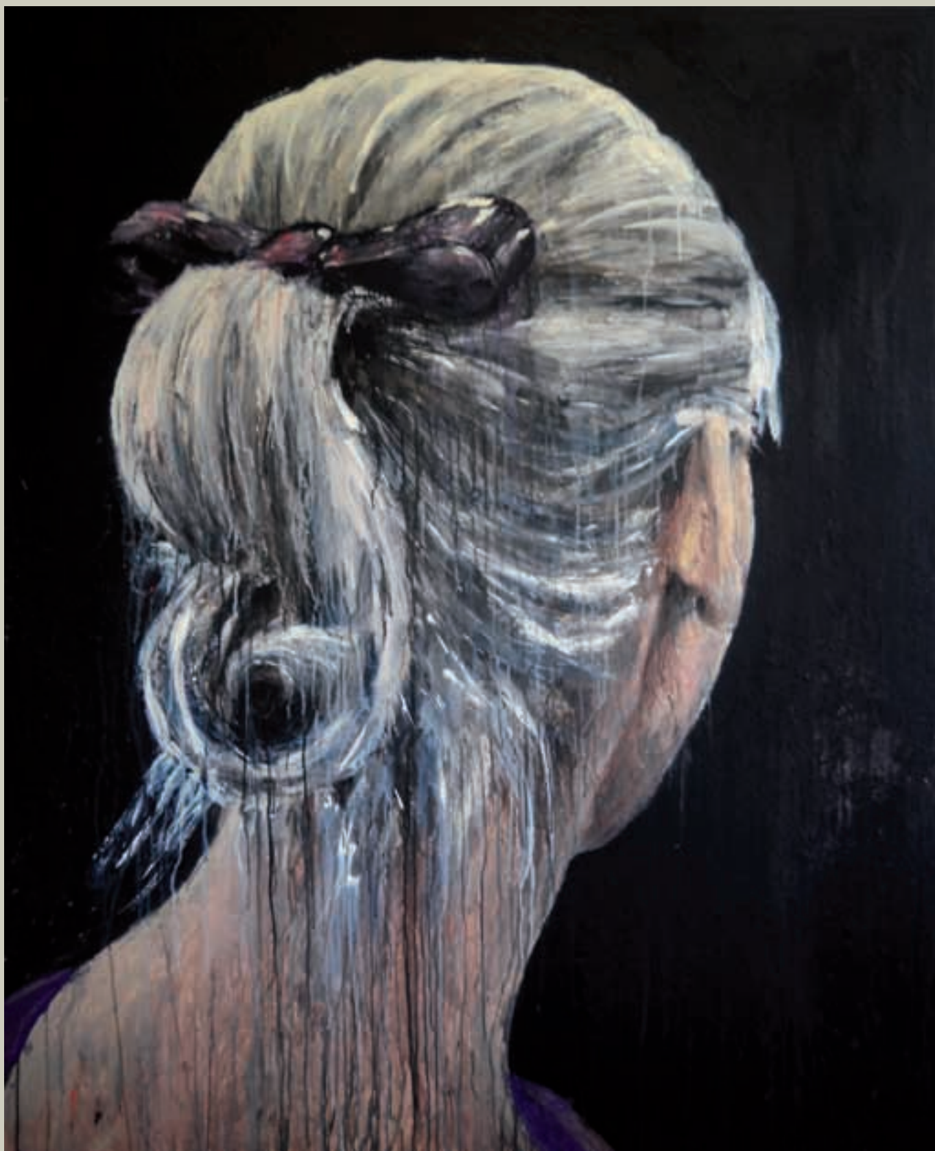
The nek - 2009 Technique mixte 162 x 130 cm