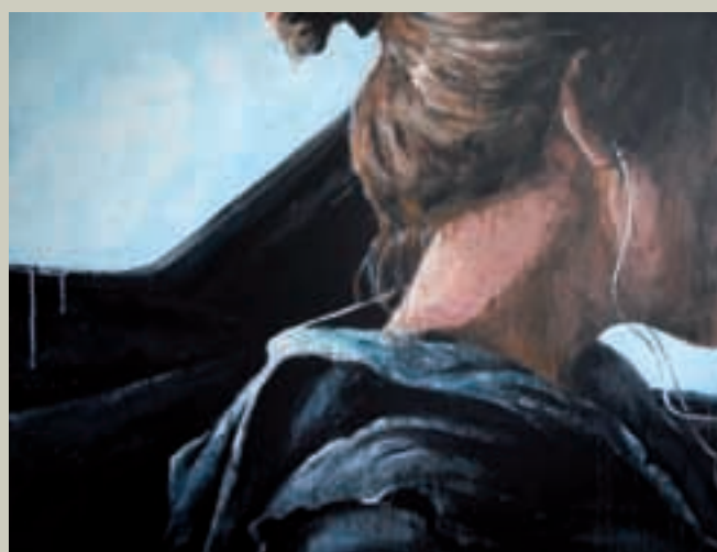
Journey with the Ipod - 2010 Technique mixte 130 x 97 cm