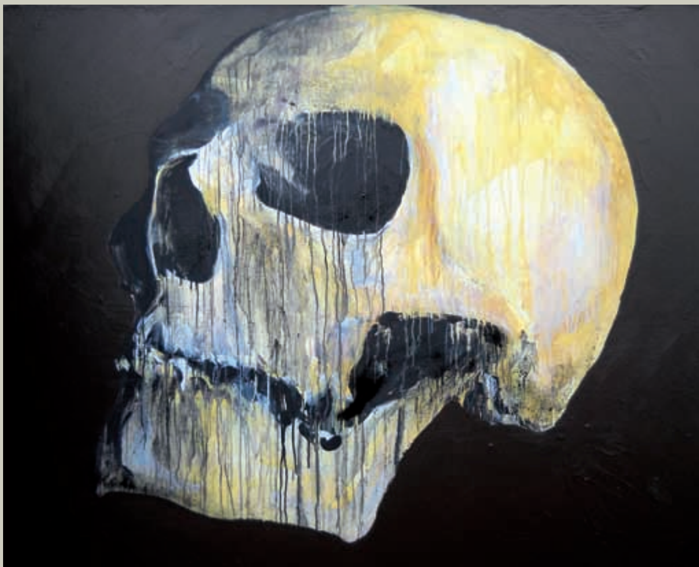
Vanity - 2010 technique mixte 162 x 130 cm